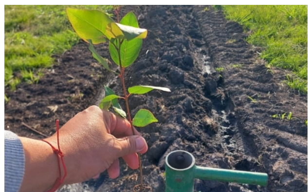
Neuanpflanzung auf La Morena