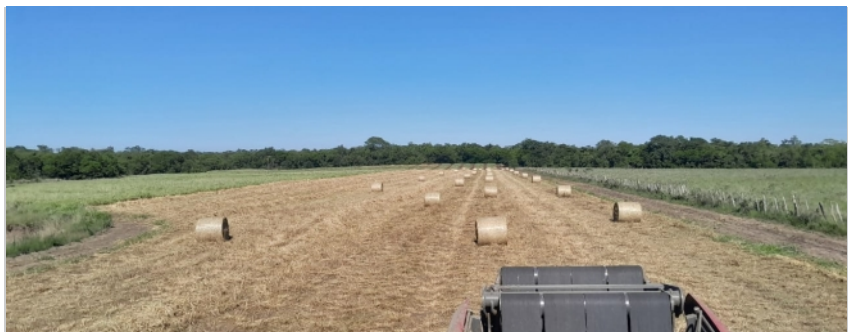
Heuproduktion auf La Morena 4