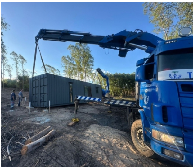
Aufstellung des Tiny Houses

Foto-Bericht vom Fundament bis zu den Außenanlagen