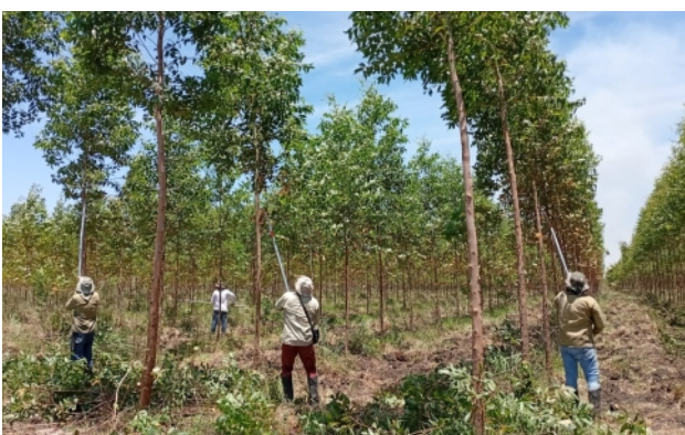
Aufastung auf Iturbe