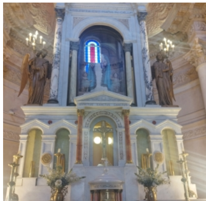
Panteón Nacional de los Héroes Asunción