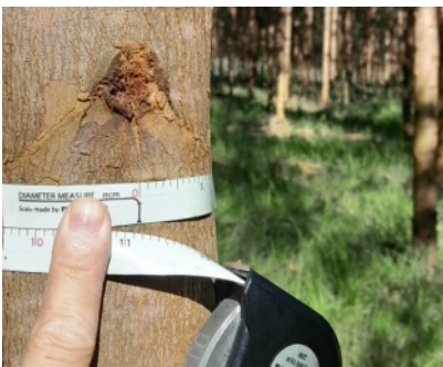
Forstinventar auf Cerro Azul

Abonnieren Sie unseren Telegram-Kanal „ Paraguay La Rivera News “ unter https://t.me/py_la_rivera und auf unserer Facebook-Seite https://www.facebook.com/2020la_rivera finden Sie Fotos, Videos und interessante Neuigkeiten rund um unsere Projekte.